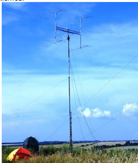
«Чемпионские» антенны диапазона 144 МГц

Среди антенн двухметрового диапазона лидируют стеки. Наиболее популярны конструкции 2x9 или 2x10 элементов. Победители использовали стек 4x6 элементов, а участники, занявшие третье и четвертое места – одну длинную антенну 14 элементов.