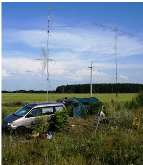
Вид на позицию команды Москвы с установленными антеннами на все три диапазона