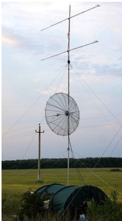
Антенны диапазонов 430 и 1296 МГц команды Москвы

пазоны 70 и 23 см. Практически все мачты вращаются при помощи поворотных устройств. Ручное управление антеннами при помощи классического руля встречается сейчас совсем редко.